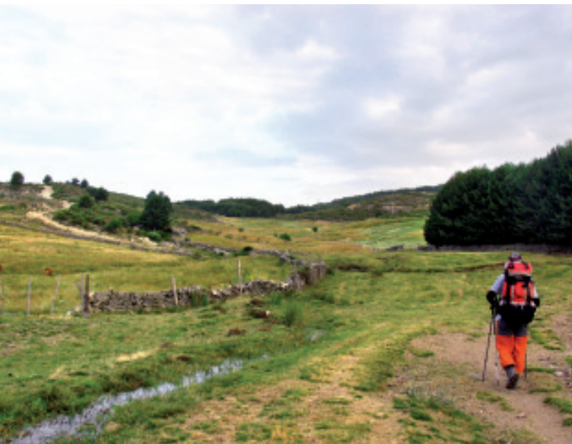
Camino a Tamborrios

Desde el puerto del Pico se ha venido por un cordel amplio y de tierra que se dirige a El Barco de Ávila. El recorrido se encuentra rodeado de grandes pinares, como el de Navarredonda, que dan sombra al camino. Hacia el lado izquierdo se sigue disfrutando la vista de la cuerda principal de Gredos, y de frente su circo con la Cabeza Redonda del Cervunal (2.194 m), la Galana (2.568 m) y el Almanzor, la máxima altura del Sistema Central (2.591 m). El camino desciende, gira a la derecha y sigue el cauce del río Tormes. Enseguida se alcanza Tamborrios, zona que cuenta con un aula de la naturaleza y con el camping Navagredos (1.454 m; 25,7 km; 7 h 45 min). Desde aquí una carretera sale hacia el campamento de Valdeascas, atravesando su bella garganta. Otro vial se dirige a Navarredonda de Gredos, a 2,3 km, localidad que cuenta con todo tipo de servicios y que se encuentra fuera del GR 10.